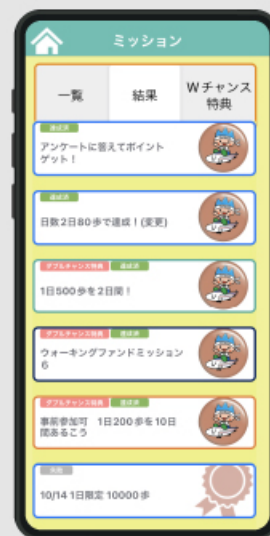
健康促進ミッション