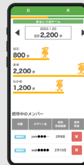
グループ機能(歩数)