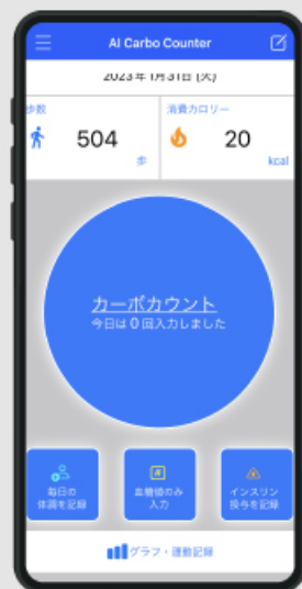
1型糖尿病 カーボカウントアプリ

データに基づいてメッセージやアラートを表示する予防・QOL向上アプリや 特定の疾患に必要なデータを取得するアプリなどの開発基盤として機能します。