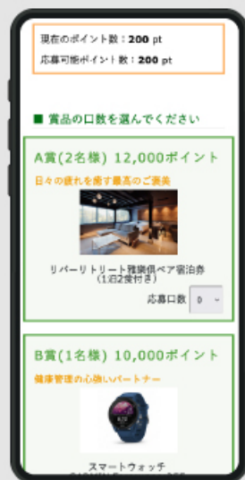
ポイント賞品応募

ポイントインセンティブ、スタンプラリーなど、楽しみながら健康活動を推進する機能を搭載。 自治体職員が運用可能なシステムを構築し、運用コストの削減にも寄与します。