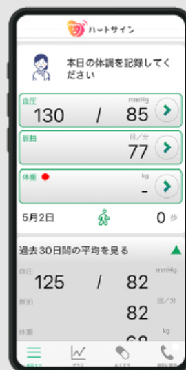
心不全セルフ マネジメントアプリ