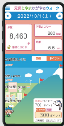
富山県公式アプリ 元気とやま かがやきウォーク

自治体からのお知らせをプッシュで通知、アンケートの配信、シビックプライドを醸成させる画面のカスタマイズなど、自治体ごとに必要な機能をカスタマイズして搭載が可能