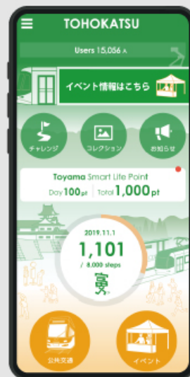
富山市公式アプリ とほ活